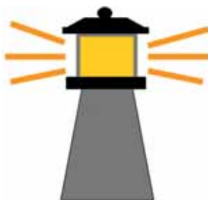
Eine Marke gibt Orientierung.

gehoben werden, dass eine starke Marke Marktanteile und Umsatz stärken wird – aber erst langfristig.